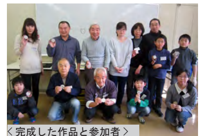
＜完成した作品と参加者＞

1時間以上、ひたすら磨くと…。小さくても立派な鏡が完成です。顔がうつるピカピカの鏡に、みなさんニコリ笑顔でした。