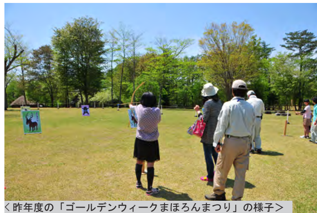
<昨年度の「ゴールデンウィークまほろんまつり」の様子>