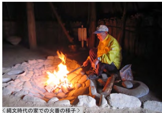
<縄文時代の家での火番の様子>

今年の 4 月からは、新たに 2 名の方を迎えて 22 名で活動を進めていきます。来館の際は、黄色のブルゾンやエプロンを着用したボランティアにぜひお声がけ下さい。