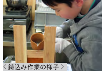
＜鑄込み作業の様子＞

すぐに定員を満たして、大盛況となった実技講座です。1月25日(日)に行いました。