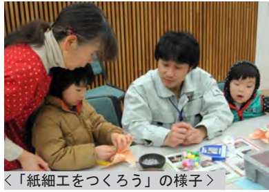
＜「紙細工をつくろう」の様子＞

2月15日(日)に、恒例の「まほろん冬まつり」を行い、400名のお客様にお越しいただきました。