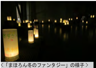
＜「まほろん冬のファンタジー」の様子＞

また、「まほろん冬のファンタジー」では、冬まつりまでの約1ヵ月間、来館者の方にご協力いただき作成した115基の灯ろうに、明かりを灯しました。願い事や今年の目標など、様々な思いが詰まったあ