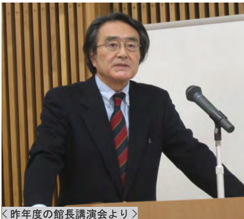
<昨年度の館長講演会より>

第 1 回は、5 月 17 日（日）で、『世界史の中の縄文文化』と題して開催します。第 2 回は 7 月 18 日（土）、第 3 回は 9 月 12 日（土）、第 4 回は 11 月 15 日（日）、第 5 回は平成 28 年 2 月 6 日（土）に実施する予定です。考古学の方法による人類史研究のあゆみと、その意義などを考える講演となる予定です。会場はいずれもまほろん講堂、定員は 60 名（先着順）で、参加費は無料です。