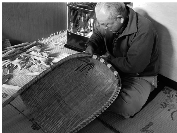
写真1 南相馬市小高区の「箕の製作技術」

例えば、先述した「福島県民俗技術調査」の中で、唯一、詳細な映像制作を実施した民俗技術として、南相馬市小高区に伝わる「箕の製作技術」がある。この映像制