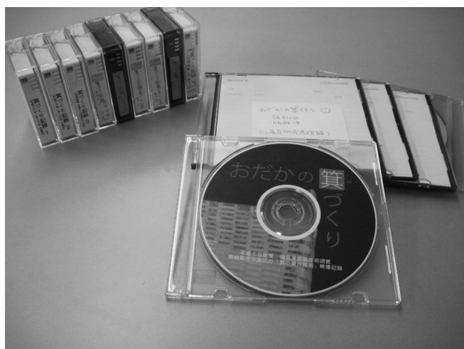
写真2 「おだかの箕づくり」DVDと収録したデジタルビデオカセット等の記録類

もちろん、百パーセント完全無欠の記録保存などなく、なにがしかの不十分な点は残るものである。とは言え、やはり