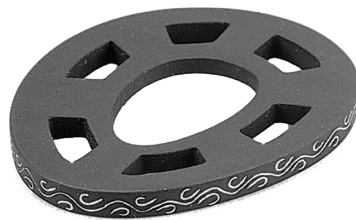
2 六窓鏝（白河市郭内横穴墓）