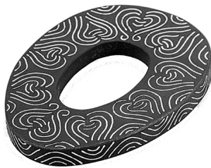
1 無窓鏝（いわき市八幡横穴墓）

写真1-1は、いわき市平下高久に所在する八幡横穴墓群内出土の板鏝で、長径7.5cm・短径5.9cm・最大厚10.4mmで、透孔はもたない（以下、無窓鏝と呼称）。写真1-2は、白河市郭内に所在する郭内横穴墓群内から出土した板鏝で、長径7.5cm・短径6.4cm・最大厚5.8mmで、六口の方形の透孔（以下、六窓鏝と呼称）をもつ。写真1-3は、須賀川市柱田に所在する跡見塚古墳出土の板鏝で、長径8.5cm・短径6.6cm・最大厚50mmで八口の方形の透孔（以下、八窓鏝と呼称）をもつ。これらの復元の経緯や工程については、当館『研究紀要2003』に詳しくまとめられているので、そちらを参照していただきたい（註2）。