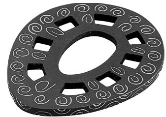
3 八窓鏝（須賀川市跡見塚古墳）