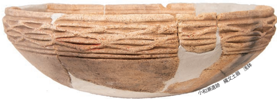
小和瀬遺跡 縄文土器 浅鉢