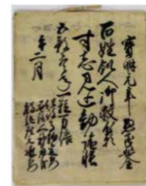
私年号「宝明」が記された寸志見込勅諭帳(馬場新家文書(その一)7)