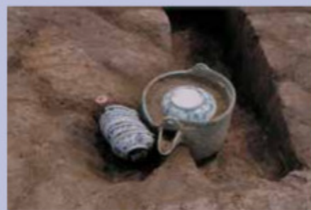
「高堂太遺跡出土 銅製提子・染付皿」 (喜多方市、同館収蔵)

所 白河市・県文化財センター白河館 まほろん 時 9:30～17:00 休 月曜日、11/24 料 無料 開 まほろん(0248)21-0700 ※院政期にあたる12世紀ごろから戦国大名・蘆名氏の治世の終りごろまでの会津の中世史を概観する考古資料展。東北地方最古の紀年銘が刻まれた石製外容器を含む「松野千光寺経塚出土資料」(県重文、喜多方市教育委員会)、室町時代ごろの「高堂太遺跡出土 銅製提子・染付皿」(喜多方市、同館収蔵)など、同館の収蔵資料や国及び県指定文化財から、現在まで続く会津の原風景を形づくった中世の世界を紹介する。