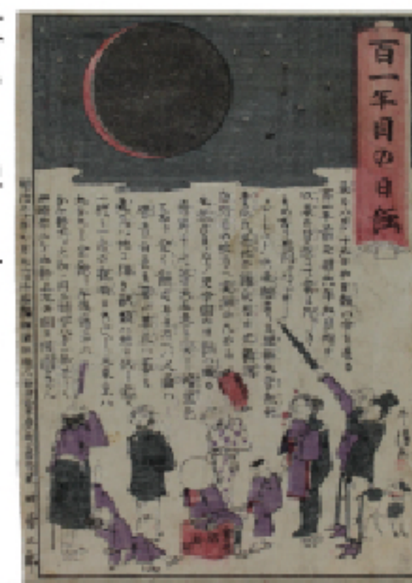
明治20年(1887)の皆既日食を 報じた錦絵(個人蔵)