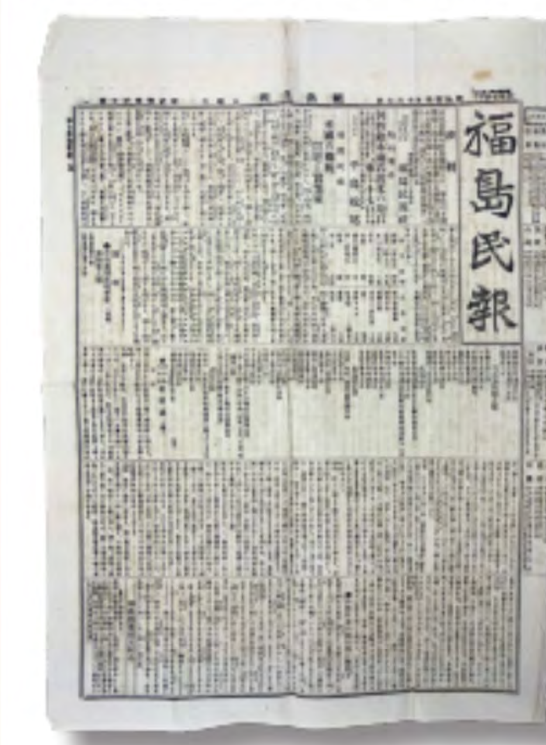
福島民報 明治26年(1893)6月8日 朝倉一郎家文書 815