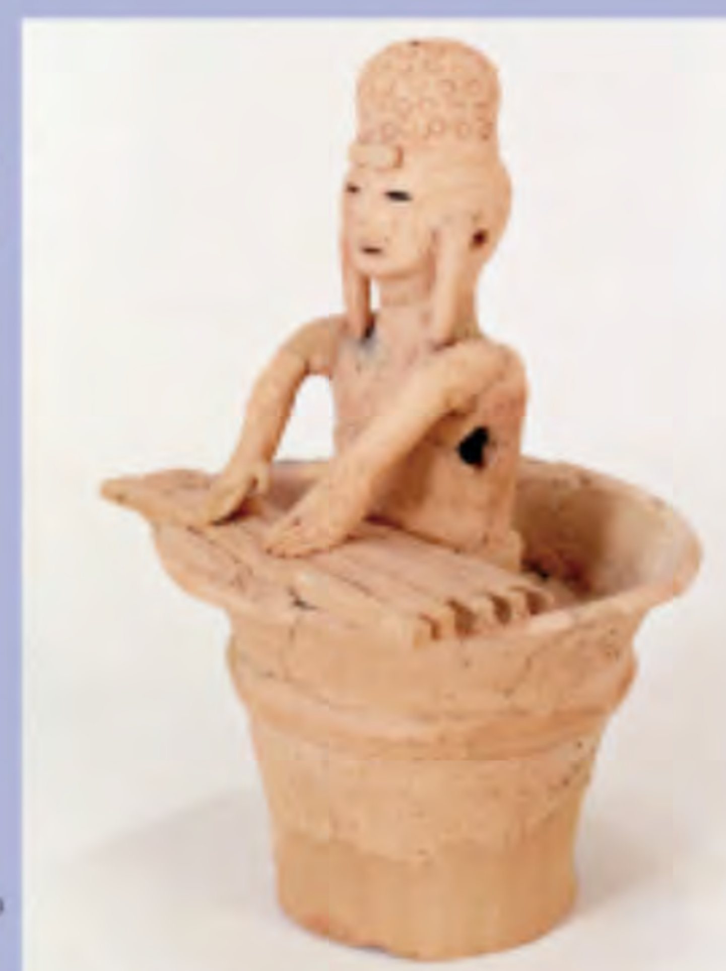
泉崎村原山1号墳 琴弾埴輪(同館蔵)

4月29日(土・祝)に展示解説会(詳細は6ページ参照)、5月5日(金・祝)にイベント「古墳時代のヨロイを着てみよう」、5月14日(日)に記念講演会など、関連イベント(詳細は要問合せ)も充実。